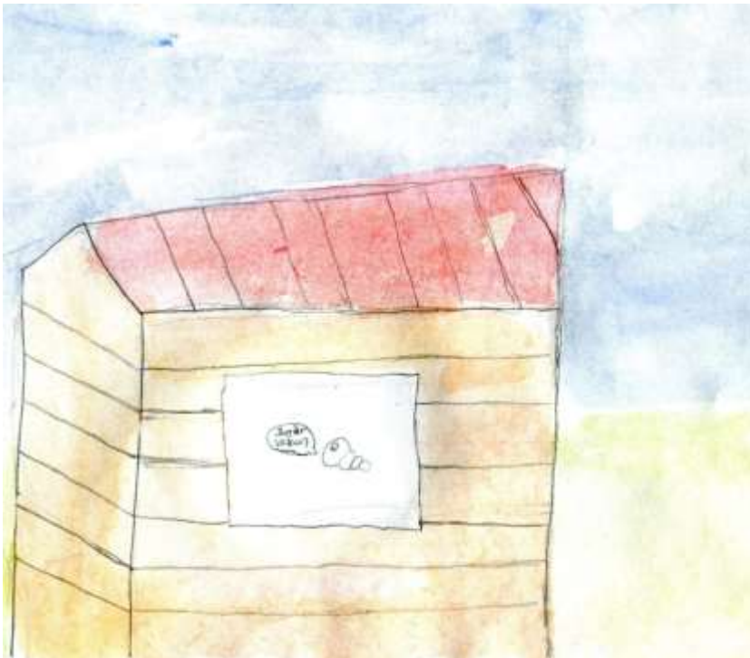
Komposternas lock målades