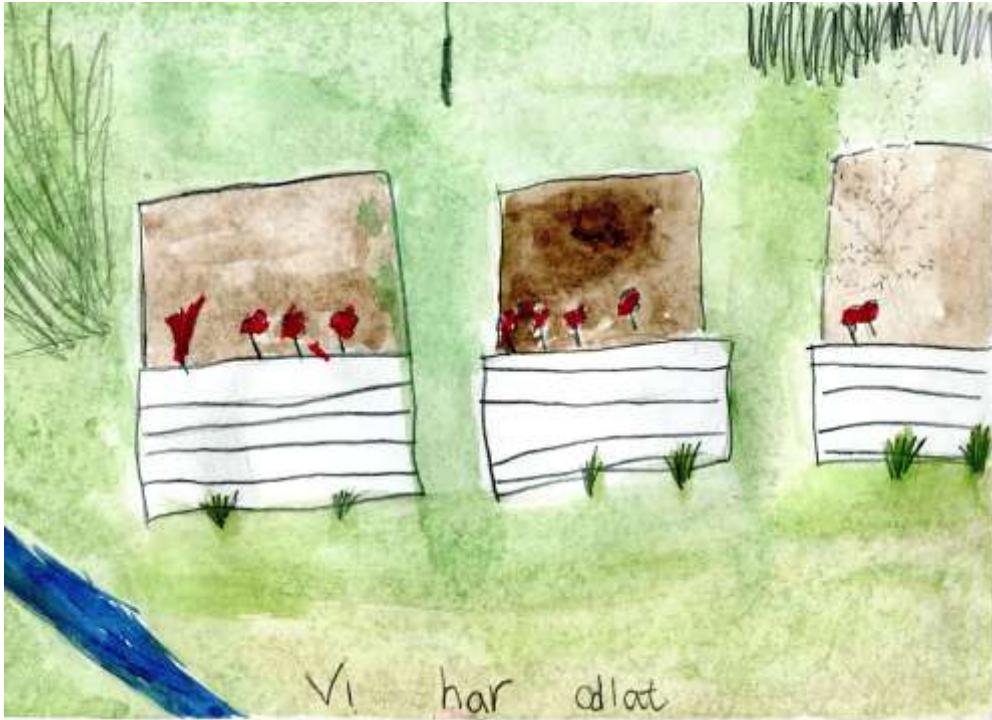
Vi målade blomlådorna i skolträdgården vita.